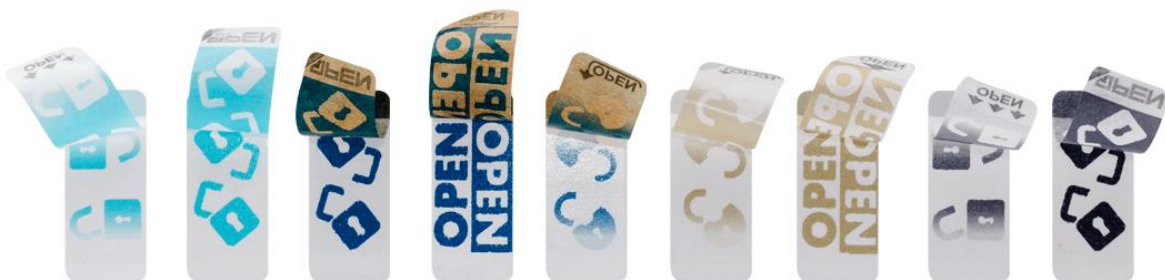
Abb. 3 - Farbvarianten, angepasst an Verpackungskarton und unterschiedliche VOID-Effekte

„Unsere neuesten Produkte lassen sich an jedes Corporate Design anpassen. Diese individuelle Gestaltungsmöglichkeit betrifft nicht nur die äußere Optik des Etiketts, sondern auch den Öffnungseffekt. Der sogenannte VOID-Effekt, der erst beim Ablösen des Etiketts sichtbar wird, kann individuell mit Logos oder Texten ausgestattet werden. Auf diese Weise wird nicht nur das Produkt umfassen geschützt, sondern auch ein eindrucksvoller Wow-Effekt beim Konsumenten erzielt“, erklärt Hr. Werner Horn.