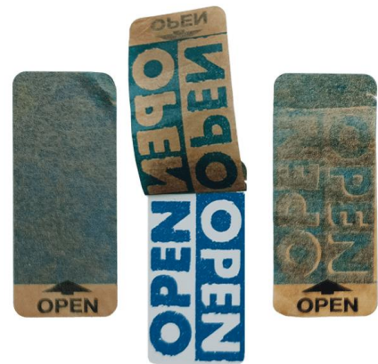
Abb. 1 - v.l.n.r.: 1. Papier-Etikett vor dem Öffnen, 2. Sicherheitsetikett bis zur Abziehbremse geöffnet - der individuelle Öffnungseffekt wird sichtbar, 3. Ein Wiederverschließen wird sofort angezeigt

Die Produktschiene nachhaltiger und umweltfreundlicher Sicherheitsetiketten von Securikett erfreut sich seit Kurzem einer weiteren Neuheit. „Ausgestattet mit einer Öffnungslasche und einer Abziehbarriere bieten die neuen Papier-Sicherheitsiegel nicht nur innovative technische Funktionen, sondern erzielen durch ihre Optik beim Abziehen einen für Konsumenten sehr wirkungsvollen Sicherheitseffekt“, zeigt sich Werner Horn, geschäftsführender Gesellschafter von Securikett überzeugt.